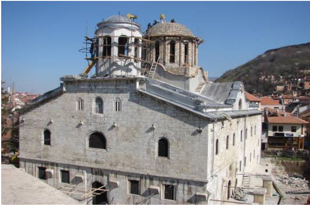
Епископията „Св. Георги” в Призрен, 2007 г.