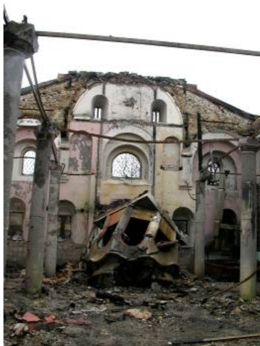
Епископията „Св. Георги” в Призрен, април 2004 г.