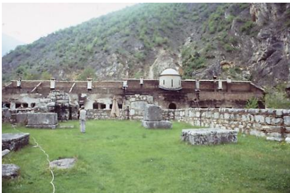
Средновековният манастир „Св. Архангели” край Призрен, април 2004 г.