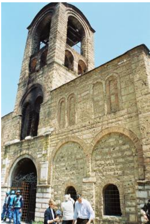
Епископската църква „Богородица Левишка” в Призрен, април 2004 г.