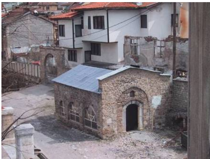
Църквата „Св. Георги Рунич” в двора на Епископията в Призрен, март 2007 г.