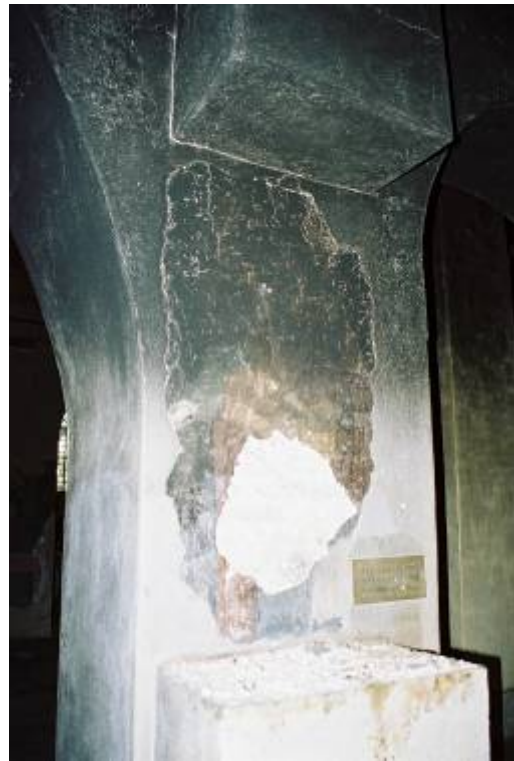
Богородица с Христос „Кърмител”, до и през април 2004 г.