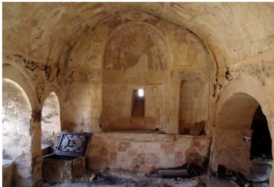
Църквата „Св. Георги Рунич” в двора на Епископията в Призрен, април 2004 г.