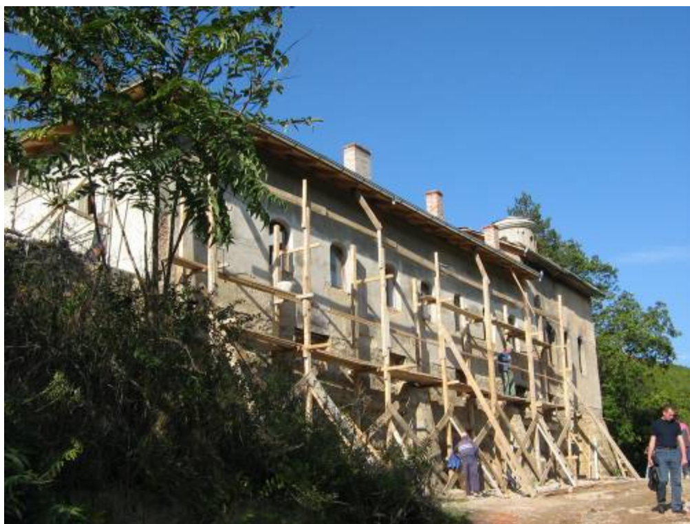
Манастир Девич, 2006 г.

Втората група обекти включваше 10 църкви от ново и най-ново време, останките от тях или, както е в град Джаковица, терените на съществуващите на това място храмове, вече напълно разчистени от руините: “Св. Никола” в Косово поле, “Св. Неделя” в Урошевац, “Св. Йован” в Печ, “Св. Петър и Павел” в Исток, “Св. св. Флор и Лавър” в Липлян, “Св. Архангели” в Штимле, “Успение Богородично” и “Св. Троица” в Джаковица, “Св. Илия” в Бистрадзин (Градиш) и “Св. Неделя” в Брняча, Ораховац.