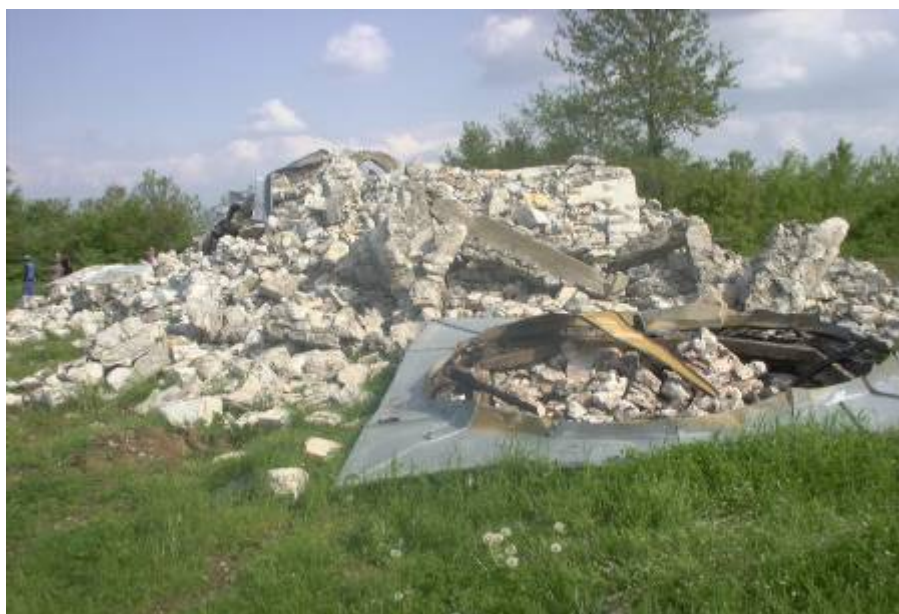
“Св. Илия” край Бистрадзин, април 2004 г.

По-особено място в програмата на мисията заема Галерията-ателие на албанския скулптор Агим Чавдарбаш в с. Чаглавица. Малката къща, превърната след смъртта на автора в галерия, е имала нещастieto да се намира сред сръбски къщи и е била изгорена заедно с тях. този случай е илюстрация на сляпото безмислие на събитията от месец март.