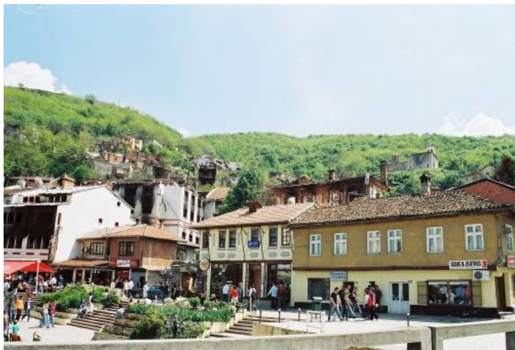
Призрен, април 2004 г.