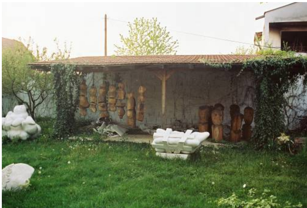
Галерия ателие на скулптора Агим Чавдарбаш, април 2004 г

По-особено място в програмата на мисията заема Галерията-ателие на албанския скулптор Агим Чавдарбаш в с. Чаглавица. Малката къща, превърната след смъртта на автора в галерия, е имала нещастieto да се намира сред сръбски къщи и е била изгорена заедно с тях. този случай е илюстрация на сляпото безмислие на събитията от месец март.