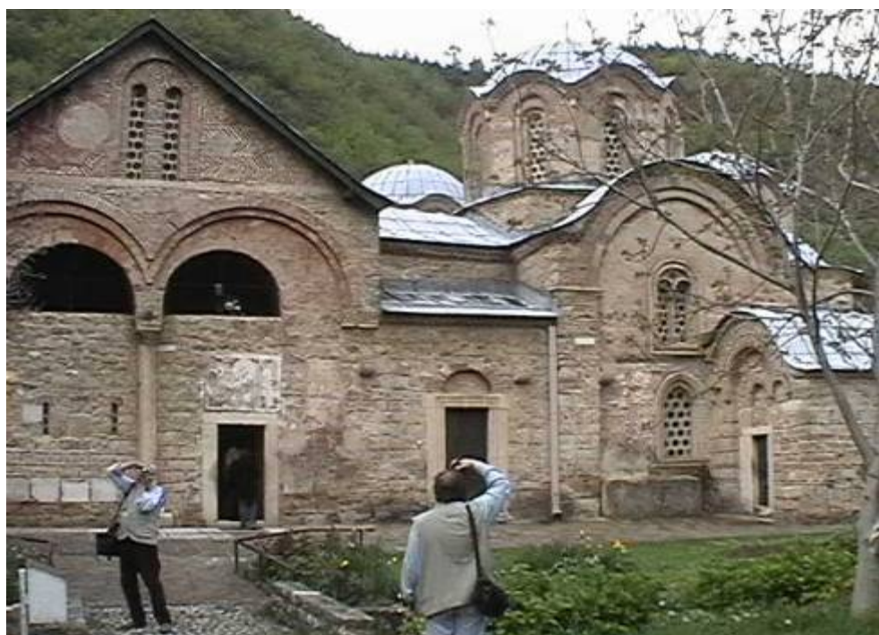
Печката патриаршия, април 2004 г.

Третата група включваше големите манастири: Грачаница, Дечани и Печката патриаршия. Манастирът Грачаница се намира в едноименното село, което е център на неголемия сръбски анклав, намиращ се недалеч от Прищина, поради което манастирът и уникалните фрески не са пострадали. Манастирите Дечани и Печката патриаршия се намират в южната част на Косово, но благодарение активната намеса на силите от италианския контингент опитите за атака са били парирани. Всъщност основната защита на всички манастири, които посети мисията на UNESCO, бе несломимият дух на монасите и монахините, които с пламъка на раннохристиянските мъченици са останали със своите обители и в най-тежките моменти.