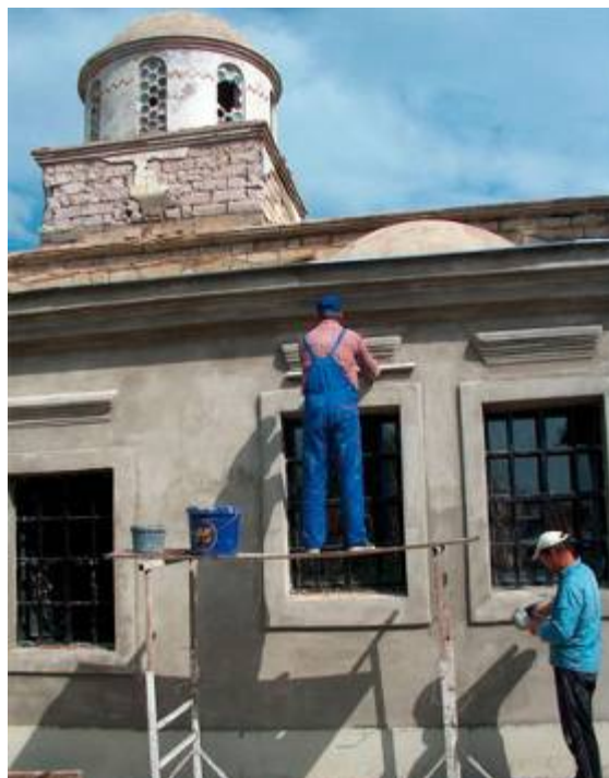
Църквата “Св. Никола” в Прищина, 2004 и 2007 г.

В началото на този месец стартира нов мащабен тригодишен проект за подкрепа и насърчаване на културното многообразие в Косово, финансиран от Европейската комисия и Съвета на Европа - Support to the Promotion of the Cultural Diversity in Kosovo. Целта му е да се използва културното наследство като средство за постигане на помирение и диалог между общностите и за развитие на икономическия потенциал на този сектор в Косово. Проектът ще се реализира в три главни направления.