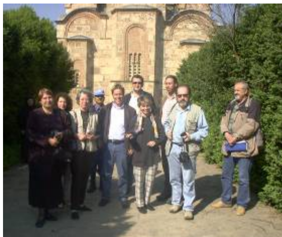
Експертната група в Грачаница

След събитията от 17-19 март генералният секретар на UNESCO тогава Коиширо Мацура лично разпорежда организирането на нова мисия, която да установи пораженията върху паметниците в Косово. Мисията на UNESCO в Косово е организирана за по-малко от месец и бе проведена от 26 до 30 април 2004 г. Международната експертна група се състоеше от представители на UNESCO и от независими експерти – историци на изкуството, реставратор.