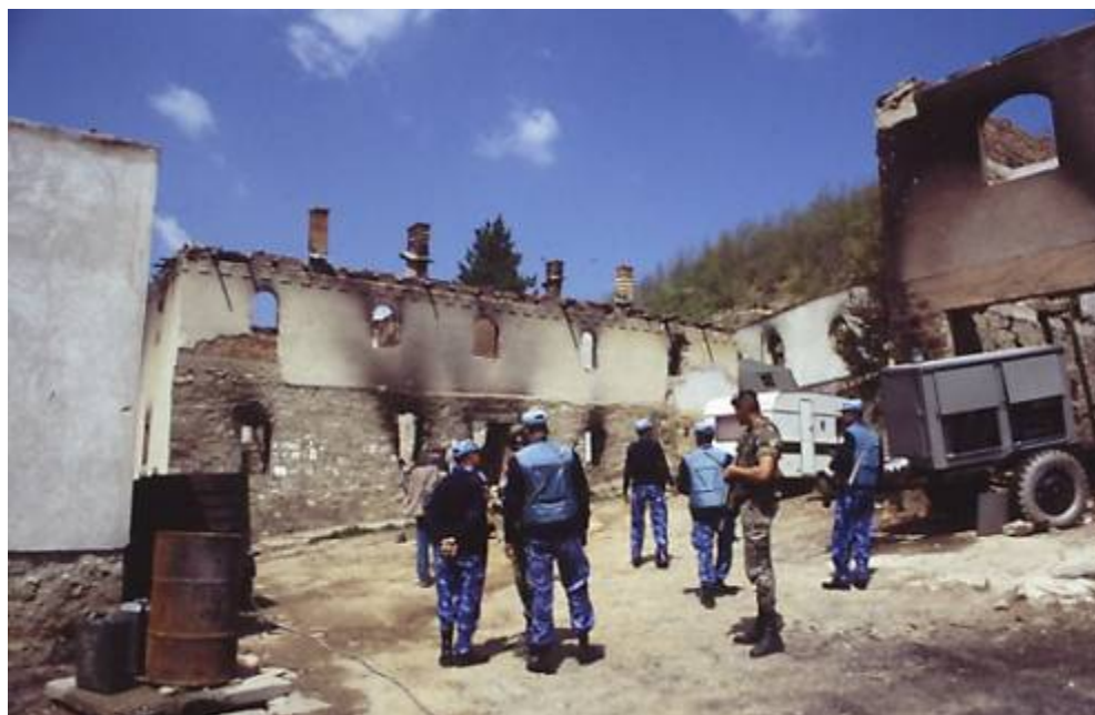
Манастир Девич, април 2004 г.